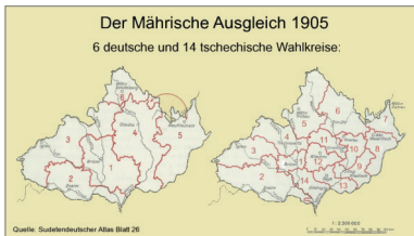
Sudetendeutscher Atlas, Blatt 26, 1954