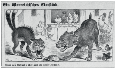
Kikeriki!, 27. Februar 1910