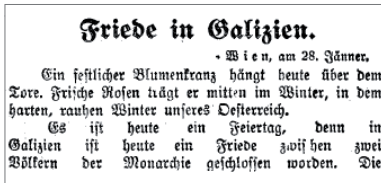
Reichspost, 29. Jänner 1914