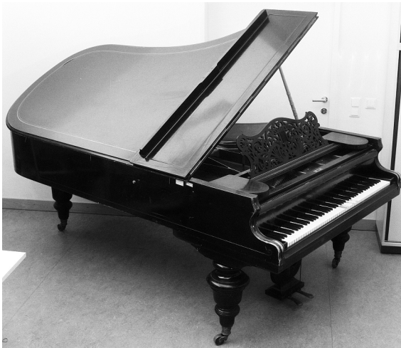
Abb. 1: Der „Adler-Flügel“ am Institut für Musikwissenschaft. 9

Herrn Professor Guido Adler / Hochwohlgeboren / Erlaube mir ganz ergebene Mittheilung zu machen, daß ich gerne bereit bin für Ihre kunstwissenschaftlichen Arbeiten an der Universität 1 Clavier zur Verfügung zu stellen, ohne für diese leihweise Überlassung eine Bezahlung zu beanspruchen. Freue mich sehr in der angenehmen Lage zu sein, Ihnen hochverehrter Herr Professor und der akademischen Jugend dienen zu können und beehre mich zu zeichnen in aner kennendster Hochachtung / Bösendorfer. 8