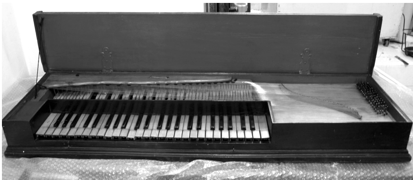
Abb. 4: Das Clavichord am Institut für Musikwissenschaft.

Das von einem bisher nicht identifizierten deutschen Instrumentenbauer vermutlich im 18. oder 19. Jahrhundert hergestellte Clavichord 20 wird in der Musikinstrumenten-Datenbank als „sehr schlicht gestaltet“ und mit „nur wenige[n] Verzierungen“ charakterisiert. Es scheint aufgrund der Abnutzungsspuren in der Vergangenheit viel gespielt worden zu sein, wurde aber bisher noch keiner eingehenden organologischen Untersuchung unterzogen. Im Inventarbuch von 1974 wird es unter der Nummer 611-1/5 folgendermaßen beschrieben: „Clavichord, ohne nähere Bezeichnung (Unterseite handschriftl. Signatur J.Ch. Mayer 21 u. Reparaturvermerk v. Hermann Seyffarth, Leipzig-Gohlis vom 15. April 1899.)“ Der Bestandwert wird mit 20.000 Schilling angegeben.