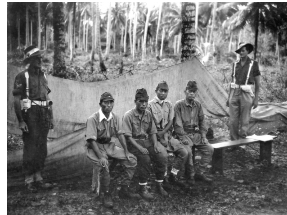
Labuan Island, North West Borneo 1945. Two military policemen guard four japanese prisoners outside the court.