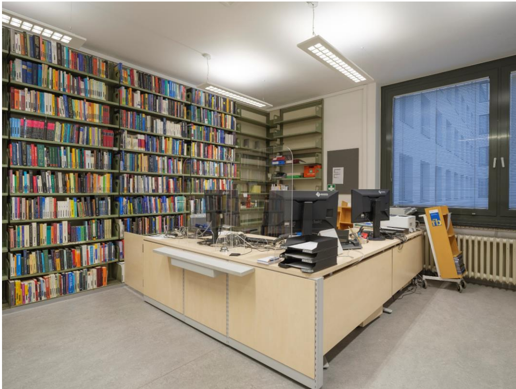
© 2023 [Martin Ellinger] CC BY-NC-SA 4.0 International