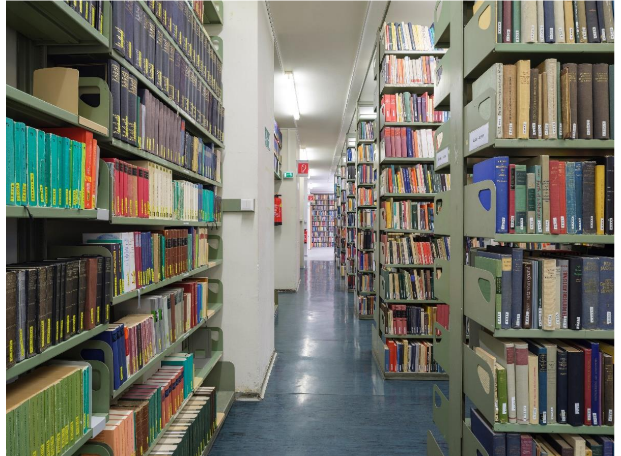
© 2023 [Martin Ellinger] CC BY-NC-SA 4.0 International