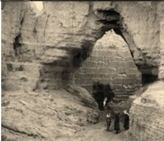
römischer Damm von al- Kharbaqah