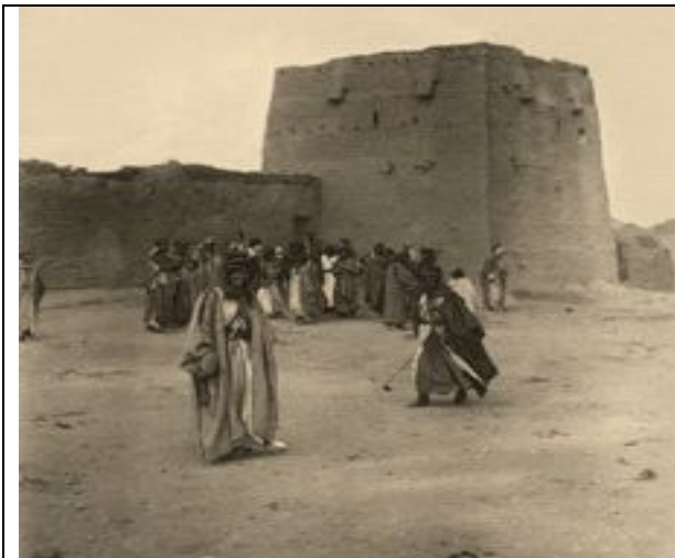
Verteidigungsturm eines kleinen Zitadelle in al-Ġauf