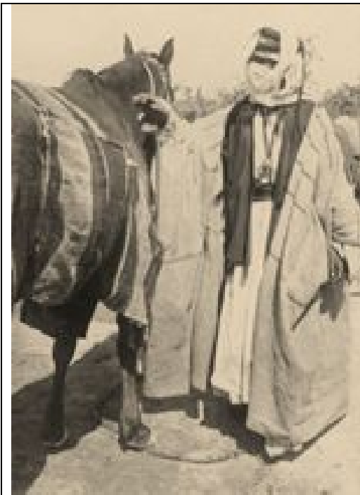
Krieger mit seinem Pferd