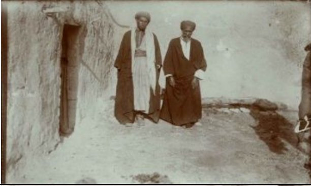
ansässige Einwohner von Ḥān Yūnis