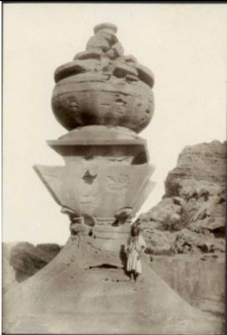
ad-Dair (das Kloster) in Petra; Detail der sog. al- Fatumah Urne