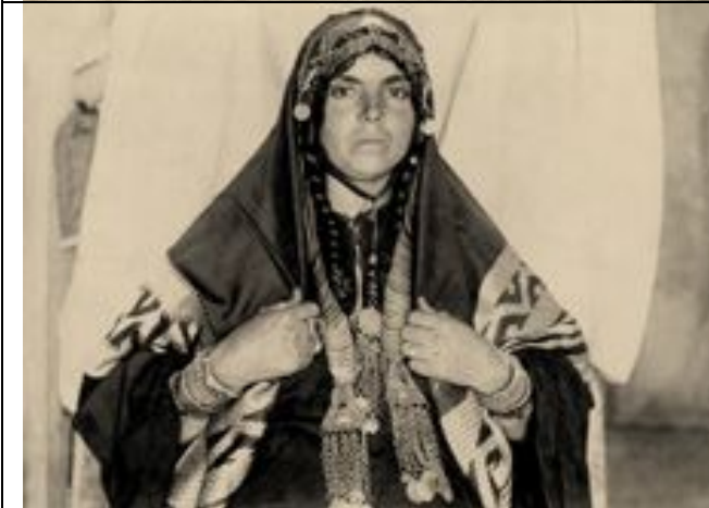
mit ihren Juwelen geschmückte Frau aus Ma'dabā