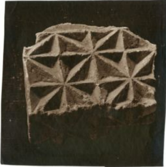
Details eines Ornaments, al-Awjah (Nitzana)