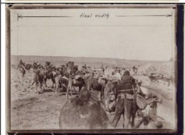
Ruala Beduinen bei einem Wasserloch