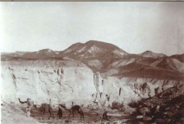
al-Mithli Pass, Negev