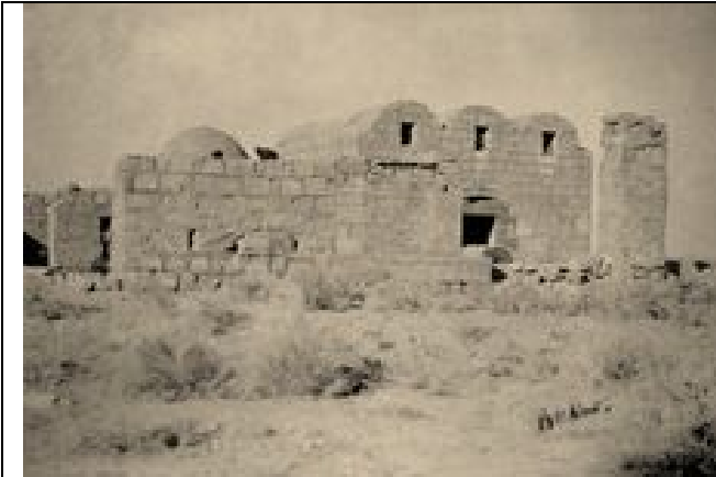
Wüstenschloß Quşair ‘Amra (Kleiner Palast von ‘Amra)