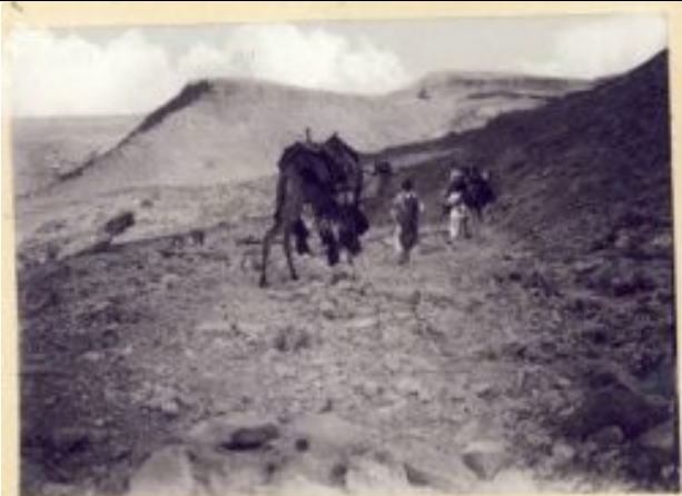
al-Dhil Pass, Negev