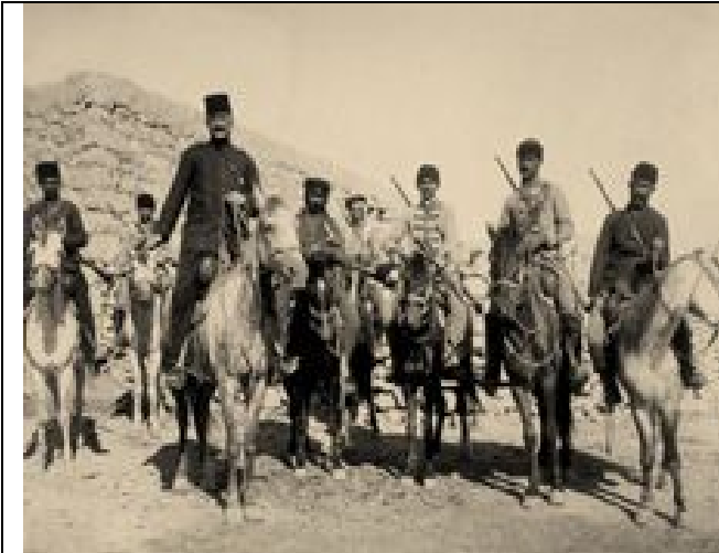
osmanische Grenzpatrouille in Ma'dabā