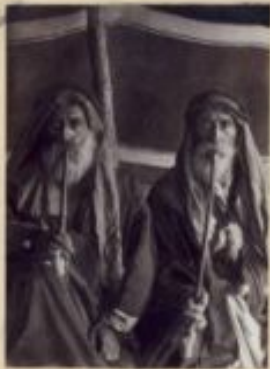
Stammesfürst des Stammes der Wahadat mit seinem Bruder