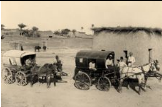
zwei Pferdewagen vor einer Schenke