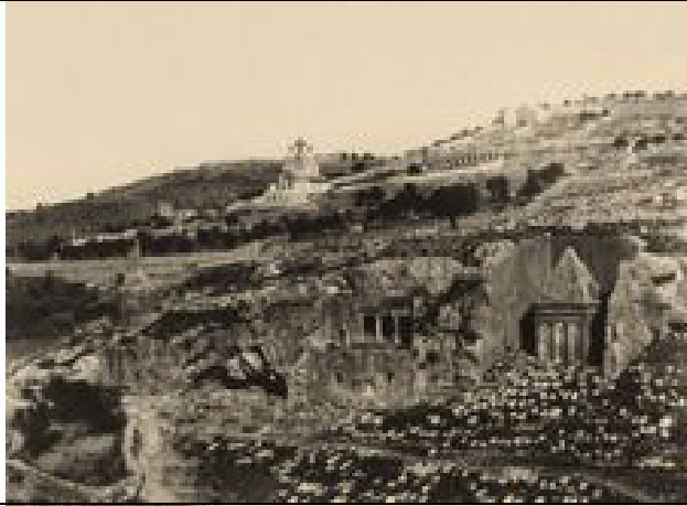
Ölberg und Gräber im Kidrontal, Jerusalem