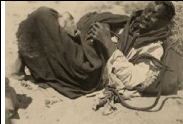
Beduine während seiner Rast