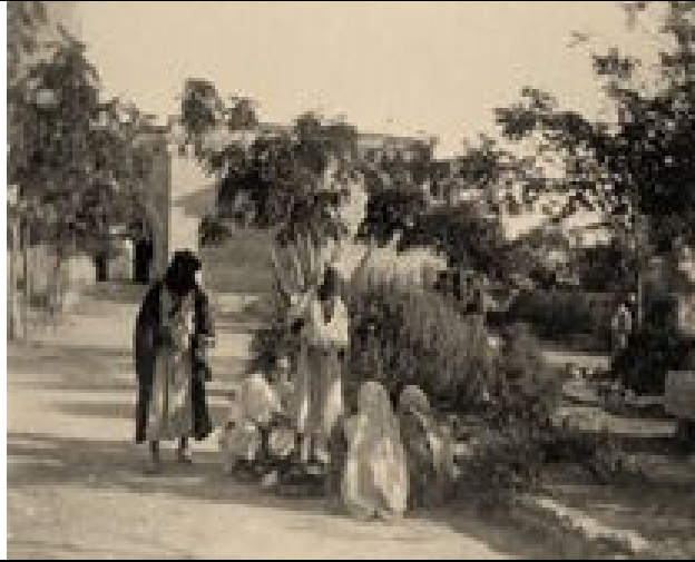
auf dem Gelände des al- Tantur Krankenhauses zwischen Jerusalem and Betlehem