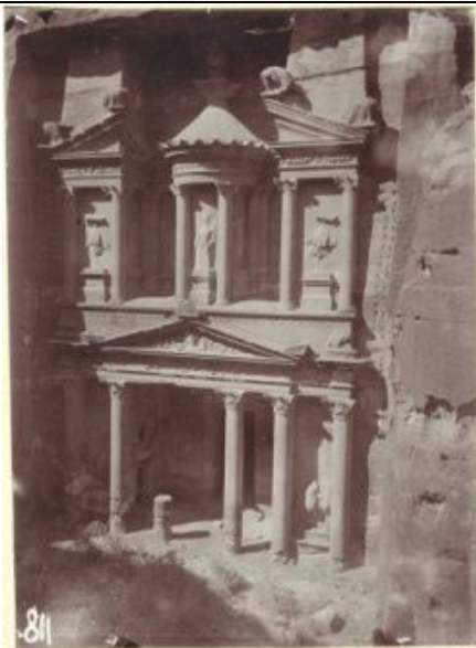
Ḥaznat al-Fir'awn (Schatzhaus des Pharao) in Petra