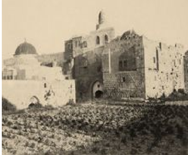
Abendmahlssaal und Davidsgrab, Jerusalem