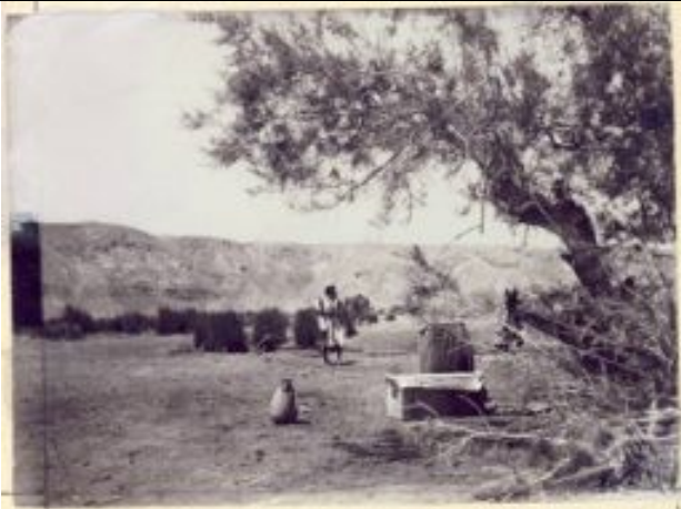
Ghadyan-Quelle (Jotvata), Wadi Araba