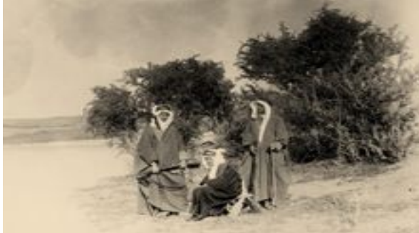
Alois Musil unter Reisegefährten anonym