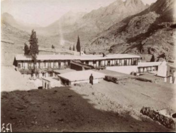
Katharinenkloster am Fuße des Ġabal Kātarīn