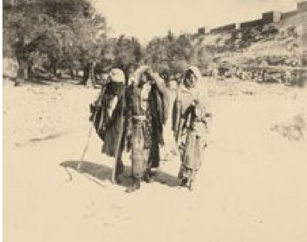
Leprakranke verlassen Jerusalem