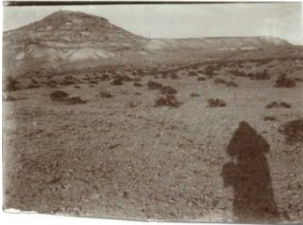
Überblick über Avdat