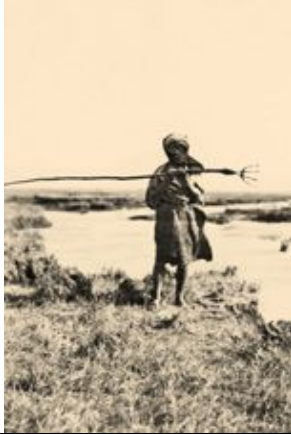
Fischer mit Harpune, al Washshāsh