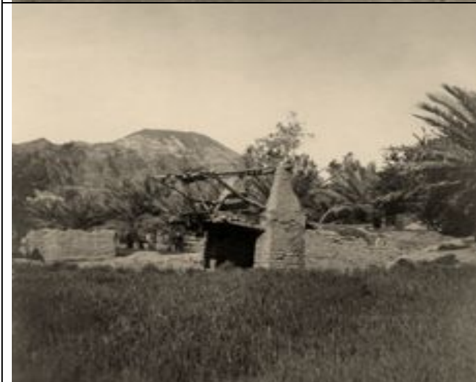
Falle für wilde Tiere in der Oase al-‘Ulā