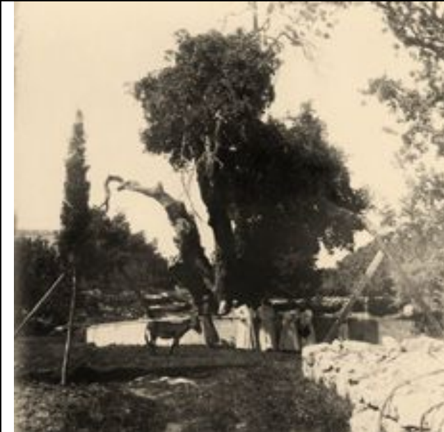
Eiche des Patriarchen Abraham in Mamre nahe Hebron