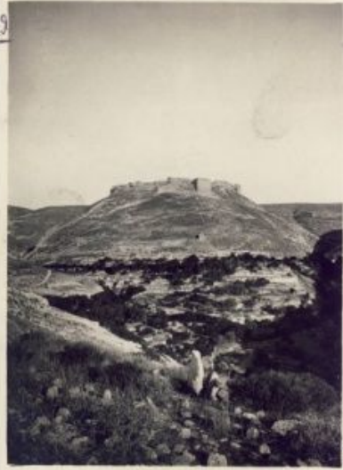
Kreuzfahrerburg Montreal (Qal'at aš- Šawbak)