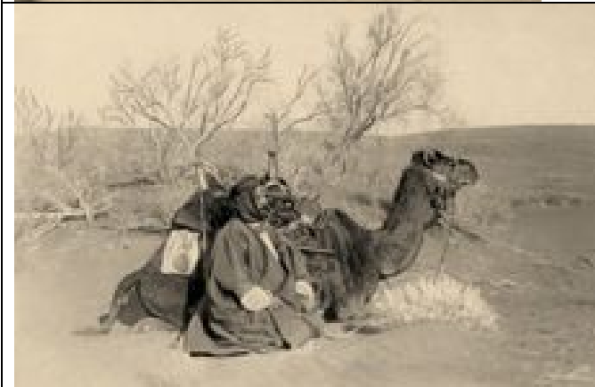
Alois Musil mit seinem Kamel in der Şahrā' an- Nafūd (Wüste Nefud)