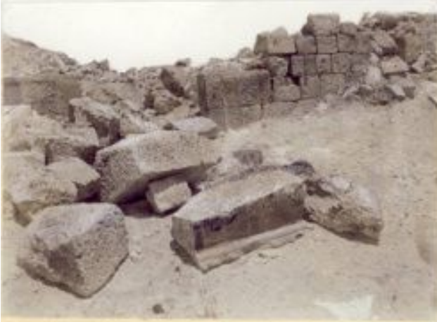
Ruinen einer der Kirchen in Avdat