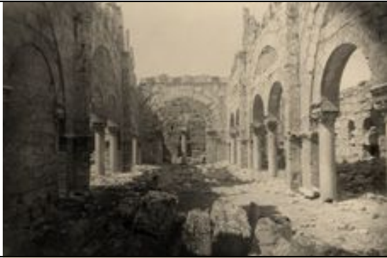
Innenraum der Basilika St. Sergius, ar-Ruṣāfa (Sergiopolis)