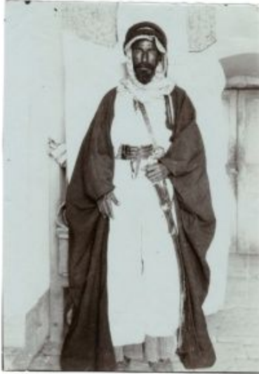
Talal ibn al-Fayez, Prinz des Beduinenstammes der Banu Sakhr