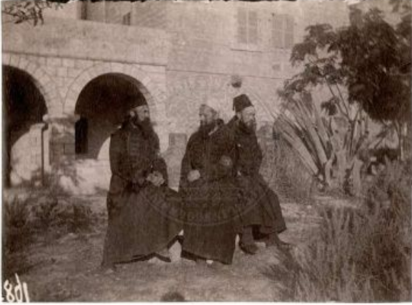
Barmherzige Brüder vom hl. Johannes von Gott im Garten des al- Tantur Krankenhauses zwischen Jerusalem and Betlehem