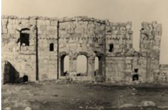
sog. „Martyrium, ar- Ruṣāfa (Sergiopolis)