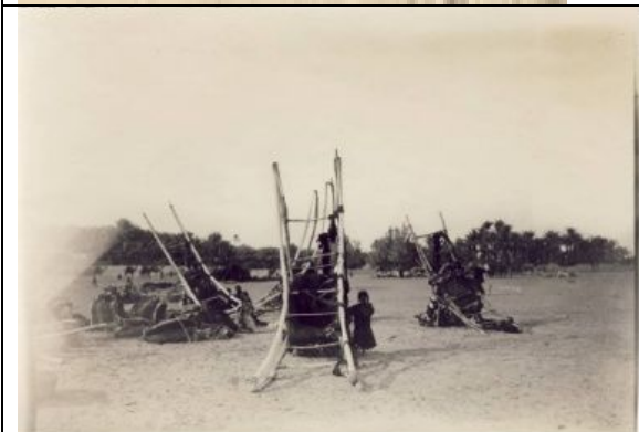
Beduinenlager mit Kamelsänfte