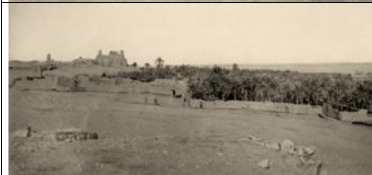
südlicher Teil von al-Ġauf und Schloss Marid