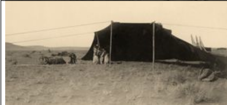
Aufschlagen eines Beduinenzeltes