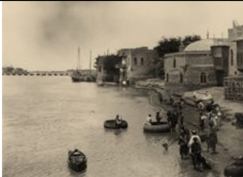
traditionelle, meist aus Schilf geflochtene, runde Korbboote ( guffāt ) auf dem Tigris