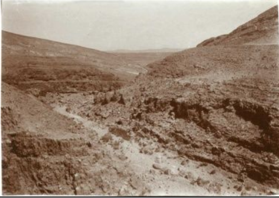
Wadi Mays südlich von Tafilah