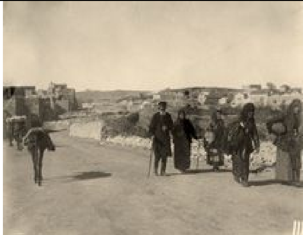
Einheimische am Stadtrand von Jerusalem