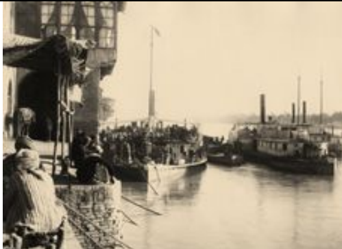
Zollstelle in Bagdad