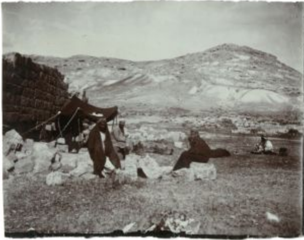
Ruinen der Nabatäerstadt Avdat vom Westen