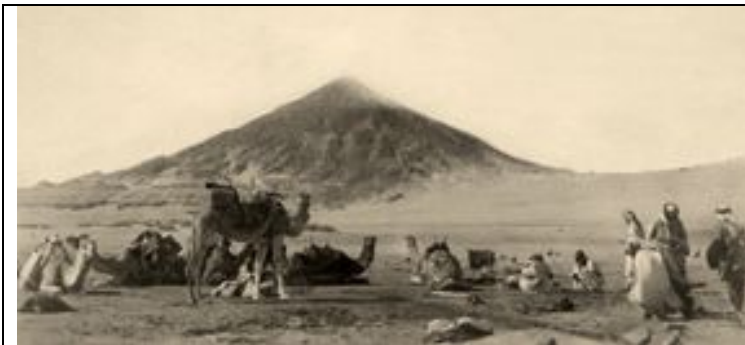
bei den Brunnen von Qarajar