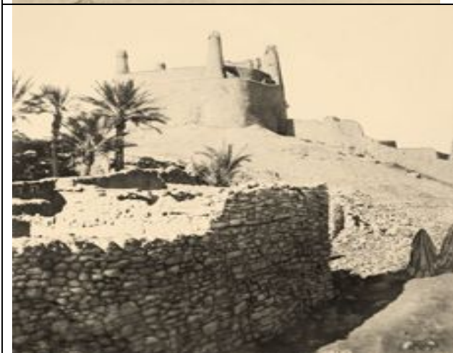
Schloss Marid in al- Ġauf