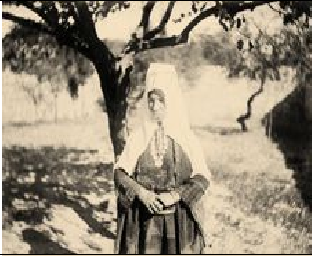
Frau aus Betlehem