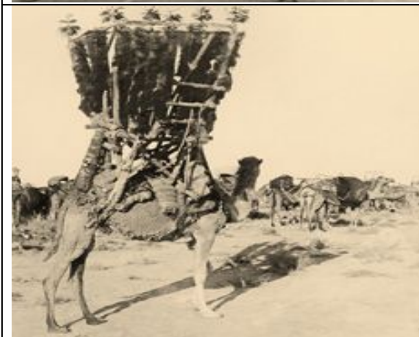
als Abu al-Duhur bekanntes Kriegssymbol des Stammes der Ruala