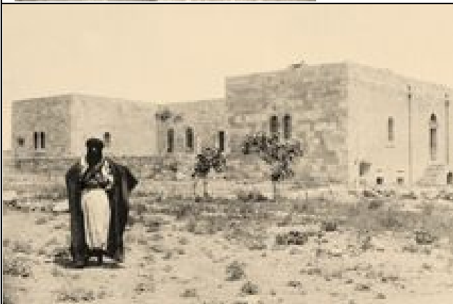
Katholische Mission in Ma'dabā