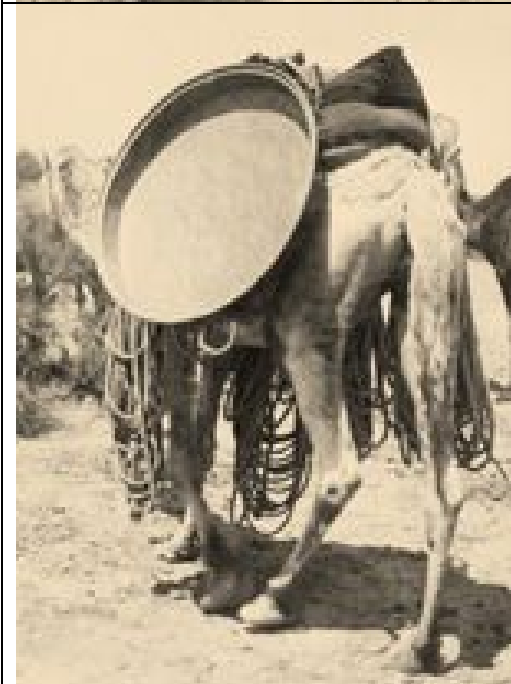
beladenes Kamel auf dem Weg