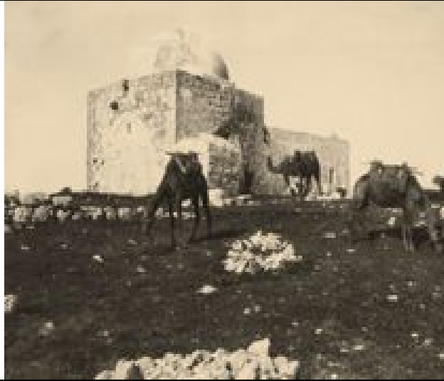
Rahelgrab nahe Betlehem