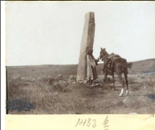
Menhir im Dorf Adir bei al-Karak