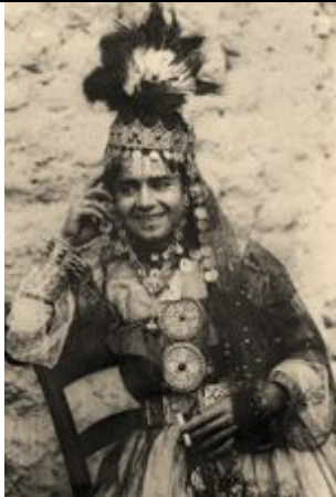
orientalische Frau anonym