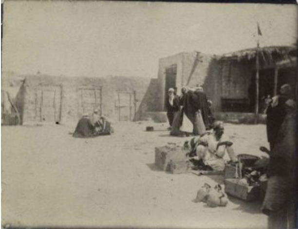
Markt von al-‘Arīš