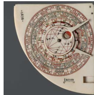
Sonnenquadrant aus Elfenbein, zugeschrieben Johann von Gmunden, 1438 datiert, aus dem Besitz Friedrich III., Wien, KHM Ivory horary quadrant, ascribed to Johann von Gmunden, dated 1438, from the estate of Friedrich III., Vienna, KHM