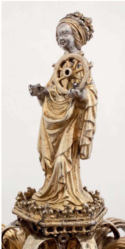
Die Heilige Katharina war die Patronin der Artistenfakultät. Sie bekrönt das älteste Zepter der Universität aus dem Ende des 14. Jh. St Catherine was the patron saint of the faculty of arts. Her likeness crowns the university's oldest sceptre from the late 14th century.