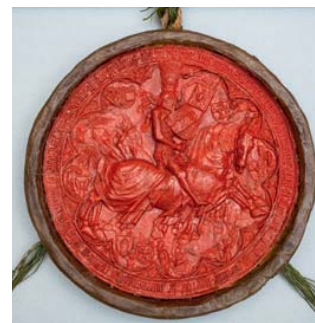
Wachsabdruck des zweiten Reiter-siegels Rudolf IV. Ab 1362 war es in Gebrauch und diente auch dazu, die großformatigen Gründungs-dokumente zu autorisieren. Archiv der Universität Wien Wax impression of Rudolph IV's second equestrian seal. In use from 1362, this seal served to authorize the large format foundation deeds. Vienna University Archive