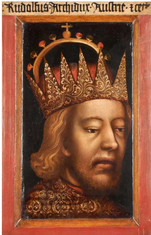
Porträt Herzog Rudolf IV. mit der erfundenen Krone eines Erzherzogs, um 1360, Dommuseum – Domkapitel. Portrait showing Duke Rudolph IV with invented archducal crown, c. 1360, Dommuseum – Domkapitel.

> Statutenbuch mit Abschriften von Dokumenten, die für die Universitätsangehörigen von Bedeutung waren. Wien 1380 bis 1400, ÖNB, Cod. 5462 Constitution book with copies of documents that were relevant to the members of the university. Vienna 1380 to 1400, ANL, Cod. 5462