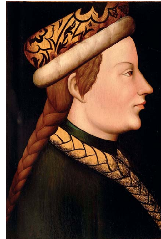
Profilbildnis des Universitätsförderers Herzog Albrecht III. (1349/50–1395). Der Bruder Rudolfs trägt das Abzeichen des Zopfordens. Kopie aus dem 16. Jh. nach einem verlorenen Original. Wien, KHM Profile portrait of university patron Duke Albrecht III (1349/50–1395). Rudolph’s brother is wearing the badge of the „Zopforden“ order. 16th century copy of a lost original. Vienna, KHM

< Krebs, Sternzeichenbild aus einer Naturencyklopädie, Wien 1440, Klosterneuburg, CCL 125, fol. 7 Cancer, sign of the zodiac from a nature encyclopaedia, Vienna 1440, Klosterneuburg, CCL 125, fol. 7