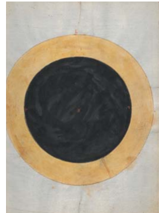
Kreisschema zum Tractatus Albionis des Oxforder Gelehrten Richardus Wallingfordus (1292–1336), niedergeschrieben von Reinhardus Gensterfelder um 1435, Wien oder Klosterneuburg, ÖNB, Cod. 5415 Cycle on the Tractatus Albionis by Oxford scholar Richard of Wallingford (1292–1336), recorded by Reinhardus Gensterfelder c. 1435, Vienna or Klosterneuburg, ANL, Cod. 5415